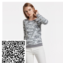
MALONE MULHER CF1032